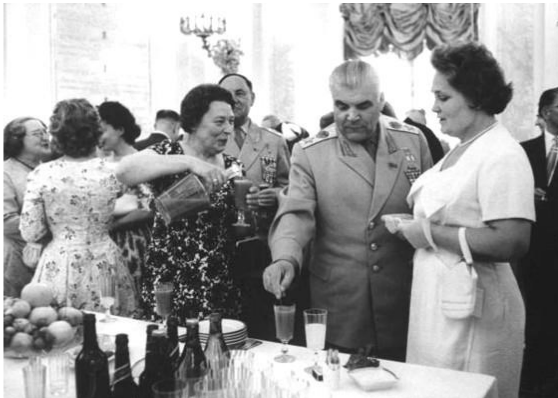
Маршал Р. Малиновский на приеме в Кремле, июль 1960.

бомбил железные дороги.. Так вот, выбирались мы по Днепру, поплыли в район Полтавы, потом в Харькове сели на поезд до Москвы. А Москву тоже уже бомбили. Было жутко, конечно. И тогда наша мама, сибирячка, повезла нас туда... А тетка из Киева уехать не смогла и погибла в Бабьем Яре... Всю войну мы прожили в Иркутске... А в 1946 г. родители развелись...».