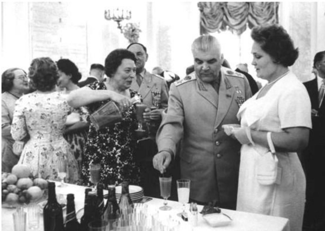
Маршал Р. Малиновский на приеме в Кремле, июль 1960.

бомбил железные дороги.. Так вот, выбирались мы по Днепру, поплыли в район Полтавы, потом в Харькове сели на поезд до Москвы. А Москву тоже уже бомбили. Было жутко, конечно. И тогда наша мама, сибирячка, повезла нас туда... А тетка из Киева уехать не смогла и погибла в Бабьем Яре... Всю войну мы прожили в Иркутске... А в 1946 г. родители развелись...».